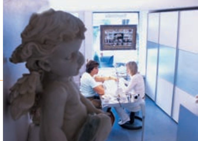
Kunstvolle Dekoelemente sorgen für Atmosphäre