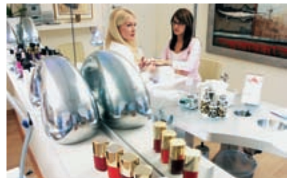
... und Frauen natürlich auch